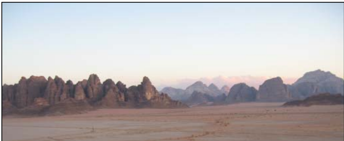
Désert du Wadi Rum