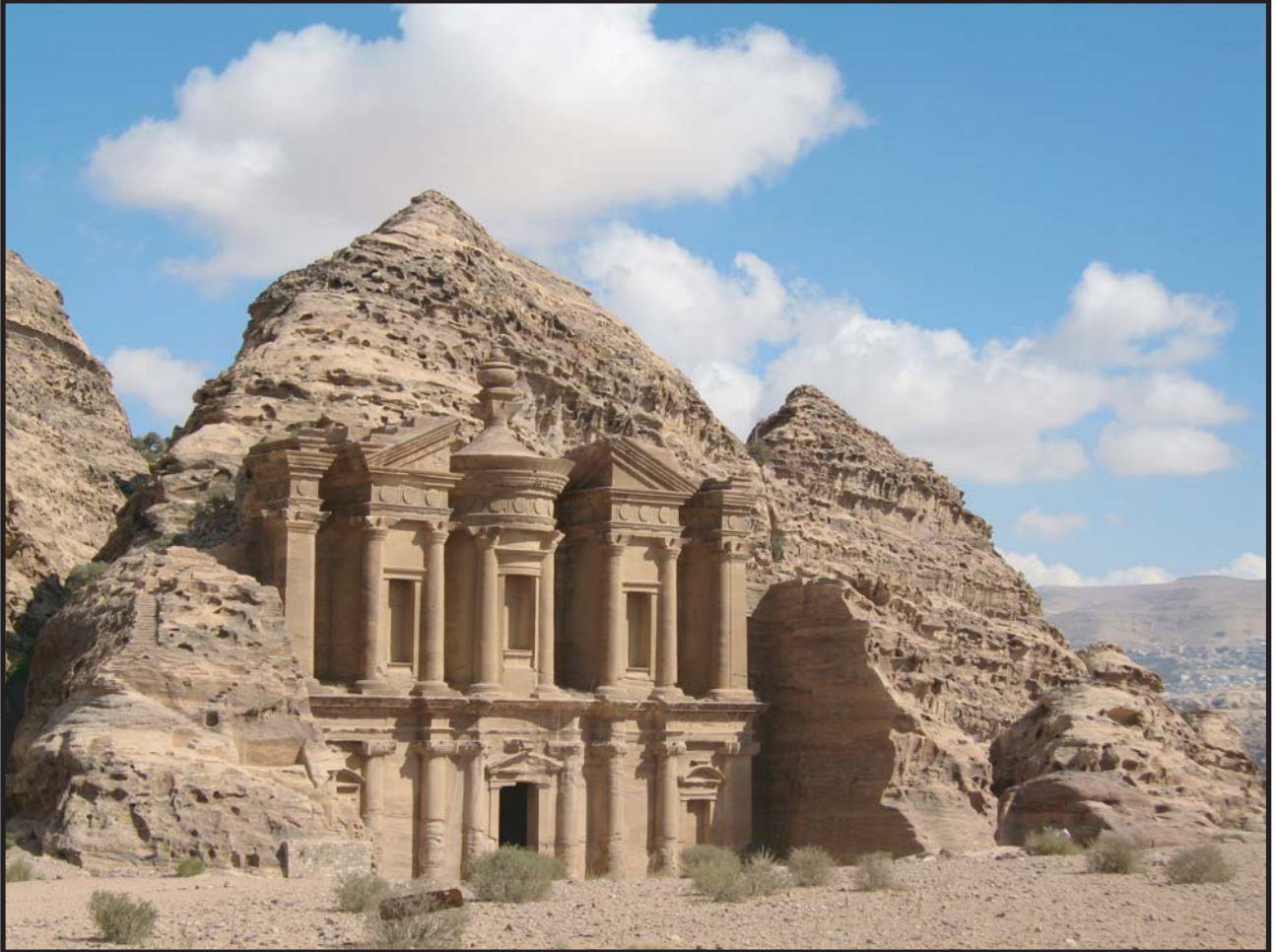
Al Deir - Petra