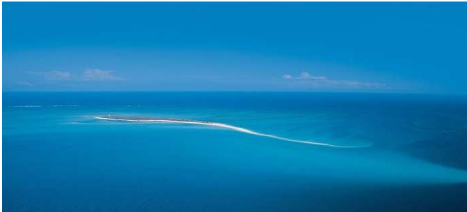
Nuit au Medjumbe Island Resort.