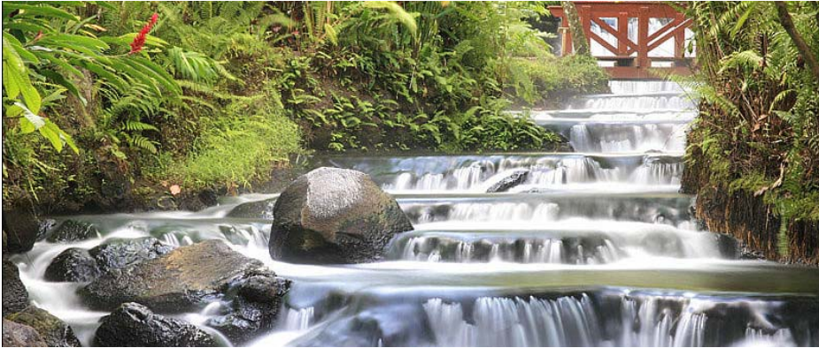
Nuit au Resort Tabacon

En soirée, la fraîcheur contrastera avec la vapeur minérale de l'eau et, si le ciel est dégagé, vous pourrez profiter d'une vue imprenable sur le volcan en éruption et ses coulées de lave orangées.