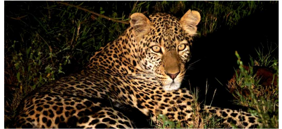
Nuit au Grumeti Hills.

Le soir, vous aurez la possibilité d'effectuer un safari de nuit (guide local, anglophone). Ceci sera l'occasion de pouvoir observer des espèces après le coucher du soleil comme les félins bien entendu, mais également d'autres animaux comme le porc-épic.