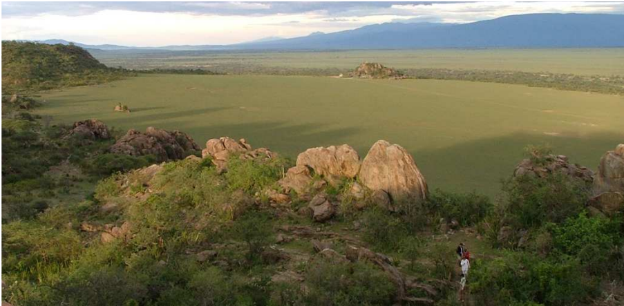
Nuit au Olduvai Camp.