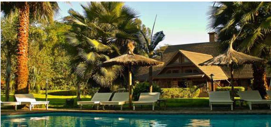
Nuit à l'Arumeru River Lodge

Arumeru River Lodge se situe non loin de plantations de café. Cet établissement qui jouit d'une nature verdoyante grâce à son vaste jardin, dispose de 21 chambres, de 6 suites juniors et d'un bungalow familial. On y trouve également une piscine entourée de palmiers ainsi qu'un restaurant en terrasse avec vue sur les monts Meru et Kilimandjaro.