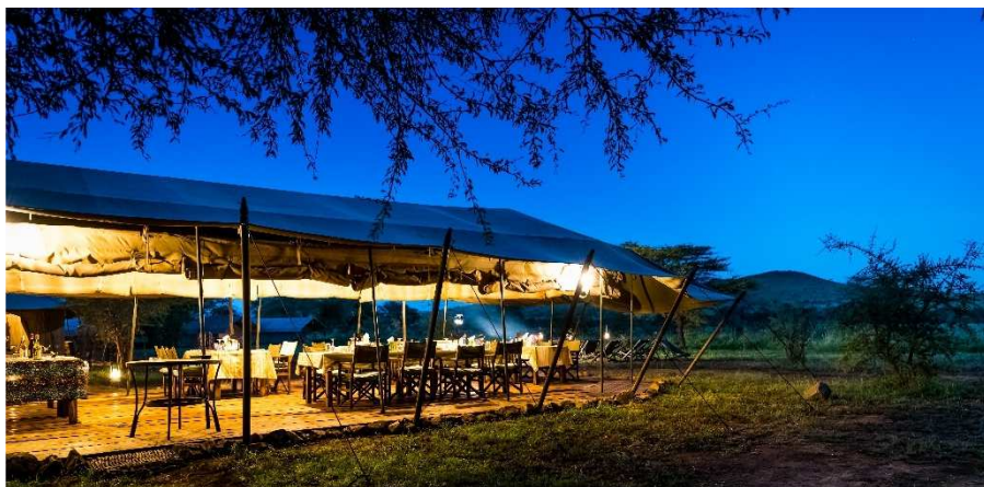
Nuit au Ronjo Camp.