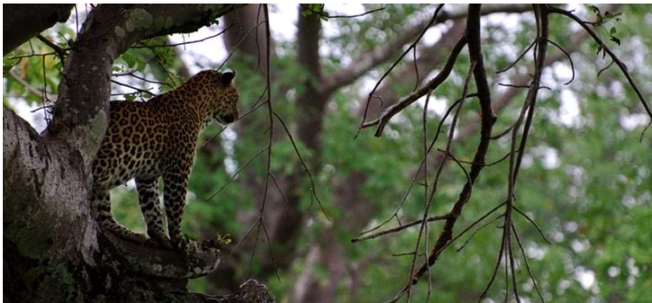
Nuits au Kigelia Ruaha Camp.

Le parc tire son nom de la rivière Ruaha qui le traverse d'ouest en est. La plupart des espèces animales y sont représentées avec plus de 8'000 éléphants, de nombreux hippopotames et crocodiles, des lions, des léopards, des guépards et plus de 370 variétés d'oiseaux dont certaines rarissimes. C'est également un endroit extrêmement favorable pour l'observation du lycaon.