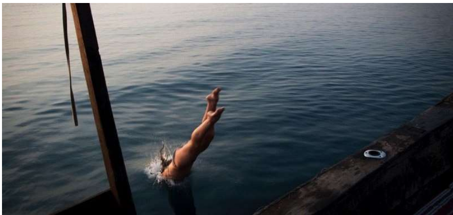
Nuits au Greystoke Mahale Camp.

Vous pourrez également partir en balade guidée dans la forêt, à la recherche des autres primates du parc ou profitez des activités offertes par le lac Tanganyika : sortie en kayak ou partie de pêche en dhow (embarcation traditionnelle) et évidemment baignade.