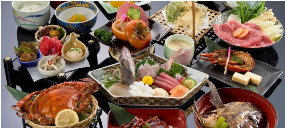
Dîner et nuit au ryokan Inishie No Yado Keiun.